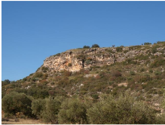
Cornisa caliza del páramo

Descendemos por el barranco del Arca acercándonos al Punto1 propuesto, ya apreciamos el valle del Tajuña, tanto al frente como a nuestra izquierda y derecha divisamos las calizas de páramo situadas a 800m de altitud y que marcan la visera del Valle, importante lugar de anidamiento de aves rapaces rupícolas de gran valor ecológico, su presencia es indicativo de la salud del ecosistema estando un área incluida en La Red Natura 2000.