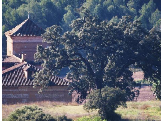
Palacio y encina de Ambite

Comunidad de Madrid. Se han hecho diversas estimaciones sobre su edad, pero todas superan los 500 años. Incluso algunos hablan de la encina milenaria de Ambite. Además, existen leyendas sobre doncellas y caballeros y el dulzor o amargor de las bellotas de la encina que se relacionan con la posible felicidad de las parejas enamoradas.