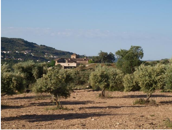
Olivar con vistas del pueblo

como singular por su valor cultural en la Comunidad de Madrid.