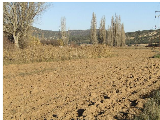
Vega con el páramo al fondo