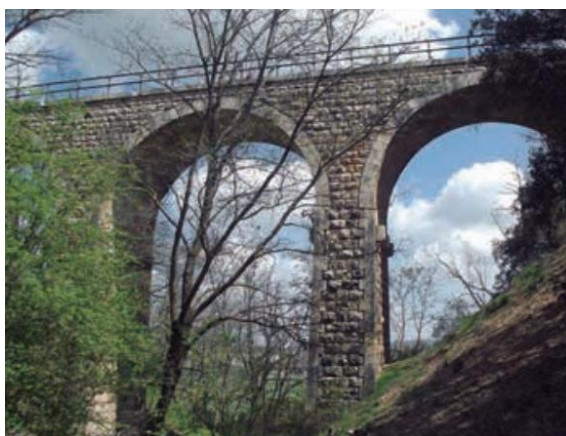
Viaducto de Valdepalacios.

En los puntos 7 y 8 nos permiten comprobar las pequeñas diferencias entre el bosque mediterráneo localizado en zona de umbría, justo enfrente al otro lado del valle, apreciamos una masa forestal compacta de encinas, coscojas y quejigos, frente a la zona de solana con una mayor presencia de arbustivas cornicabra, Jaras, gran cantidad de olivos y zonas de mayor frondosidad y concentración de la vegetación en los barrancos, también divisamos dos puntos singulares, el viaducto de Valdepalacio, actual Vía Verde el Tajuña , antiguo trayecto del ferrocarril del Tajuña y que tenía origen en la desaparecida estación del Niño Jesús en Retiro, y la Peña de Ambite punto singular para los ambiteños, cargado de historia, y leyendas.-