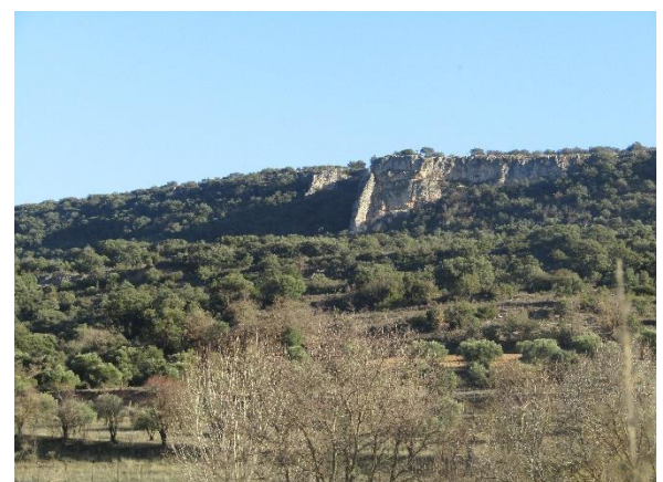
Peña de Ambite

En la solana apreciamos las terrazas aprovechadas para el cultivo del olivo en las laderas, en la actualidad el aprovechamiento queda lejos de los miles de olivos a mediados del siglo XX, un valor que recuerda "El Olivo Santo " árbol catalogado