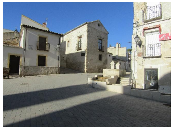
Fuente de la plaza

Saliendo de la plaza por la calle Camino de la Vega o por Calle del Molino girando a la derecha en la calle de Abajo llegamos a la calle Benito Torres, que es el camino de salida del pueblo a la vega, entre olmos y olivos divisamos la parte superior del Palacio de Ambite del siglo XVII, a su izquierda la Encina de Ambite , uno de los tres árboles que tenemos en Ambite catalogados como árboles singulares por la