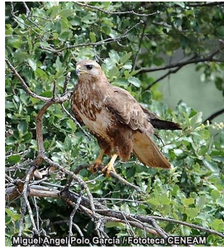
Águila ratonera ( Buteo buteo )