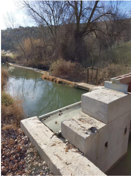
Punto 6 represa y compuerta captación del caz