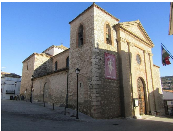
Iglesia Ntra.Sra. de la Asunción