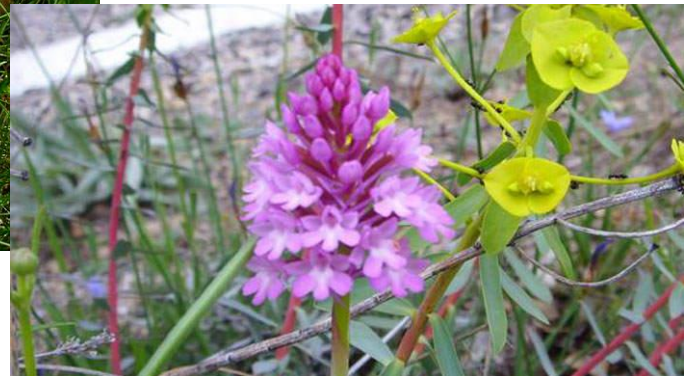
Orquídea Piramidal ( Anacamptis )