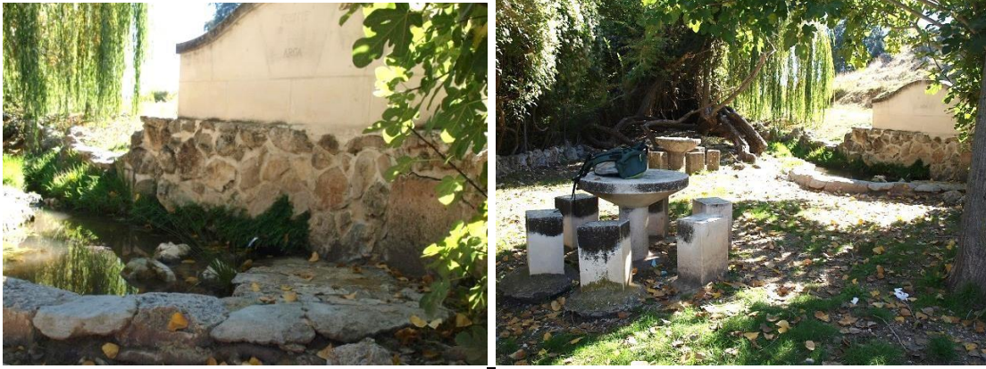
Fuente y área de descanso del Arca