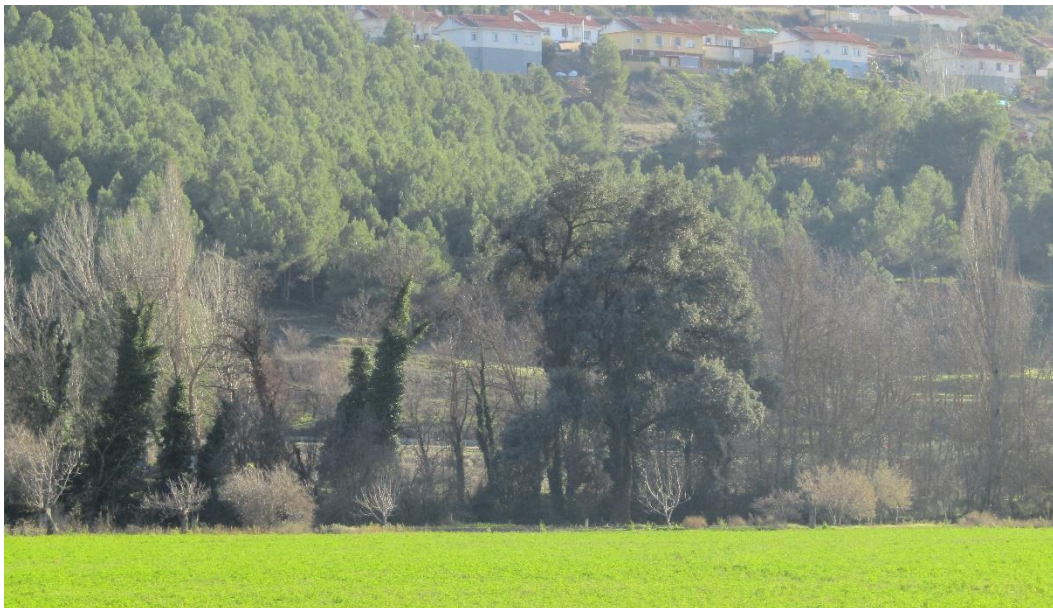
Encina de la Huerta

Más adelante en el punto propuesto 5 junto al río a los pies de un campo de alfalfa se encuentra la otra encina centenaria, la Encina de la Huerta , árbol singular de la Comunidad de Madrid. Una adaptación interesante en la encina para evitar la presión de los herbívoros (particularmente el corzo), es la presencia de pequeños pinchos en el borde de sus hojas más bajas, donde alcanzan los herbívoros, mientras en las ramas altas presentan hojas casi sin pinchos.