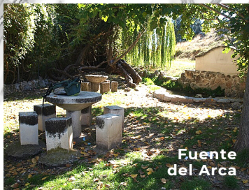
Fuente del Arca

Las Calizas de páramo marcan la visera del valle, ¿podrás divisar aves rapaces?