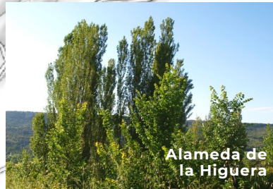
Alameda de la Higuera