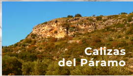
Calizas del Páramo