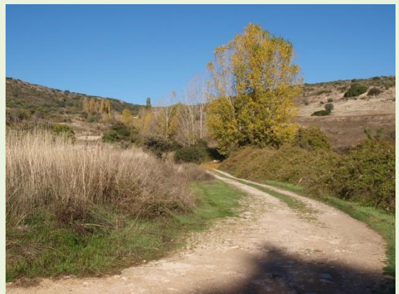
Barranco del Espinar

A lo largo del camino, nos iremos encontrando cultivos de cereal, guisantes y frutales, así como olmos y zarzas a orillas del caz. A su vez, este antiguo canal aparece cubierto por una densa mata de carrizo, que sirve de refugio a carriceros (de ahí su nombre) y otras aves palustres.