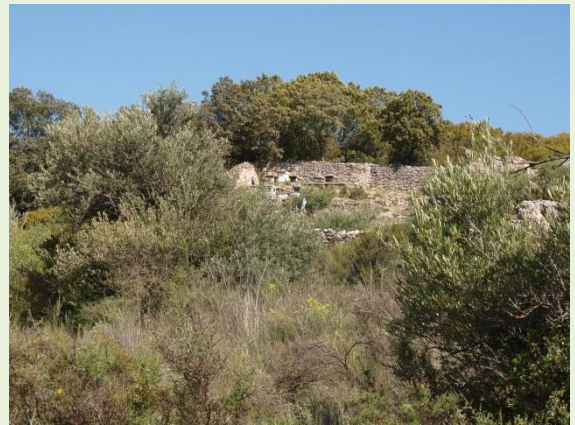
Colmenar entre el bosque mediterráneo

Por fin llegamos a la arboleda, un hermoso bosquecillo de álamos blancos, que se distinguen fácilmente por tener la corteza y envés de las hojas de ese color, y que proporcionan variedad a nuestro paseo. Se extienden hacia el río, a nuestra derecha, rodeados de campos de labor.