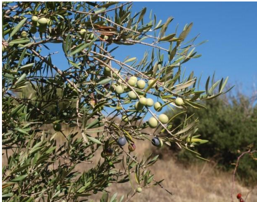
Detalle de rama de olivo con aceitunas comenzando su maduración