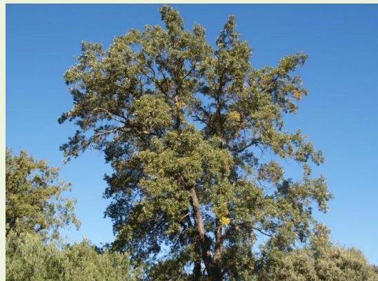
Quejigos en el Robledillo