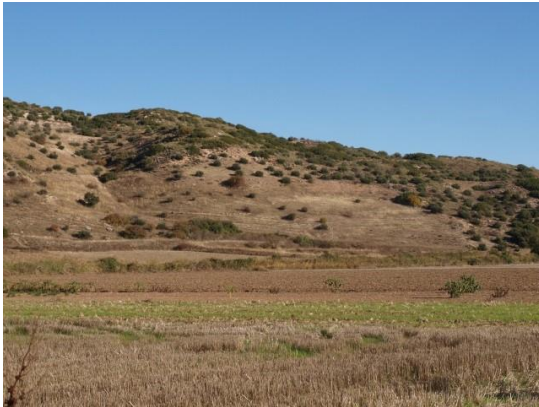
Campos de cereal y ladera con olivares

Si nos fijamos en el paisaje, apreciamos en la ladera izquierda del valle predominio de los olivares y en la ladera derecha, mezcladas con los olivares, la encina, la coscoja y otras especies del monte mediterráneo.