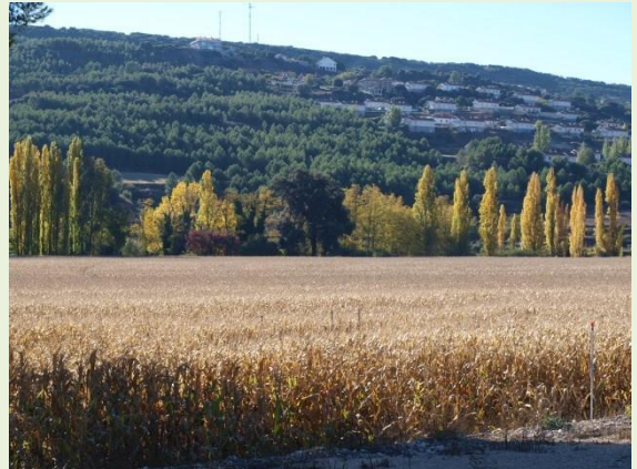
Maizal y Encina de la Huerta a lo lejos

Más adelante se divisa a la izquierda el Barranco del Espinar (flujo de agua hacia el Tajuña). Dejando el camino atrás, a nuestra derecha se extiende un gran campo de cultivo y a lo lejos, en la orilla del río, se distingue una gran encina entre los álamos: la Encina de la Huerta , catalogada como árbol singular de la Comunidad de Madrid.