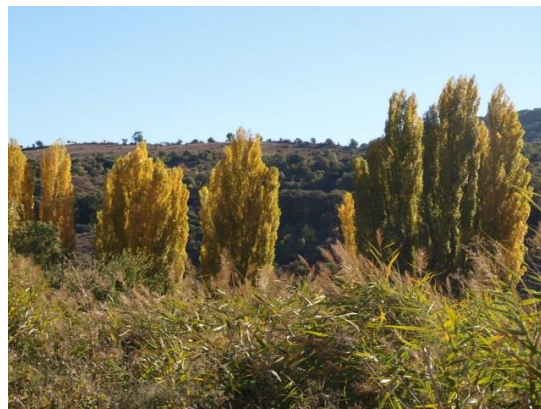
Chopos en el río en otoño

No es raro oír aquí el tamborileo del pájaro carpintero: el pico picapinos , e incluso también el pito real , más escaso. Este sonido puede provenir también de los árboles del río, de donde en primavera puede llegarnos además el canto del cuco o del ruiseñor (común y bastardo) . Esta zona es de una gran variación de color, ya que, volviendo la vista hacia el río, disfrutamos del verde entre primavera y verano, y del amarillo y el ocre en otoño, antes de que los árboles se preparen para soportar las temperaturas del invierno, que en el fondo del valle pueden descender por debajo de -10^{\circ}\text{C} .