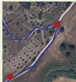
Vista satélite de bifurcación hacia la Fuente del Robledillo, por senda y por atajo

Hito 3: Bifurcación - Izquierda: subida a la Fuente del Robledillo - De frente: camino de La Vega, a Fuentenovilla