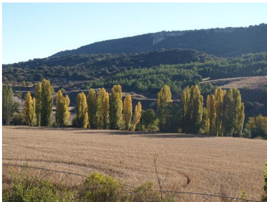
Campos y alameda

Cuando abandonamos las últimas casas del pueblo divisamos a la derecha la Peña Ambite (830m de altitud), dominando la vega del río Tajuña. En el fondo del valle podemos observar cultivos y el bosque de ribera, destacando los chopos (chopo lombardo o chopo negro, Populus nigra ), mientras a nuestra izquierda, en lo alto, asomando por encima de un olivar, se descubre el Palacio de los marqueses de Legarda , del siglo XVII, con un olivar a sus pies.