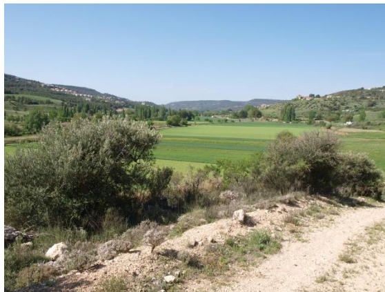
Vista de Ambite, la vega y el monte

En otoño o a finales del invierno, cualquier lugar del recorrido es bueno para observar alguna bandada de grullas en paso migratorio, con su reclamo característico mientras vuelan.