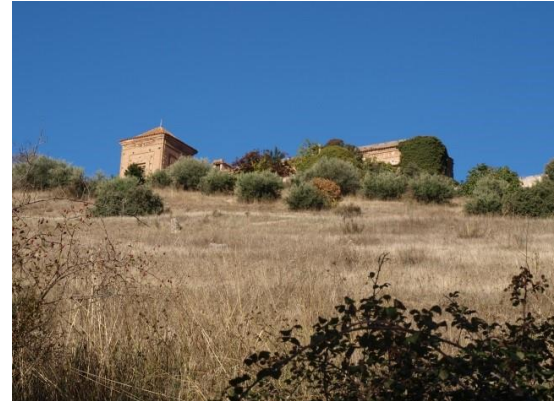
Palacio asomando tras el olivar

A la vera del camino se puede observar la introducción de especies arbóreas por el ser humano, como las arizónicas de alguna parcela o los ailantos (especie invasora). Compitiendo con ellas, un árbol emblemático de la comarca: el olmo , muy afectado por la grafiosis (enfermedad producida por un hongo transmitido por un pequeño escarabajo).