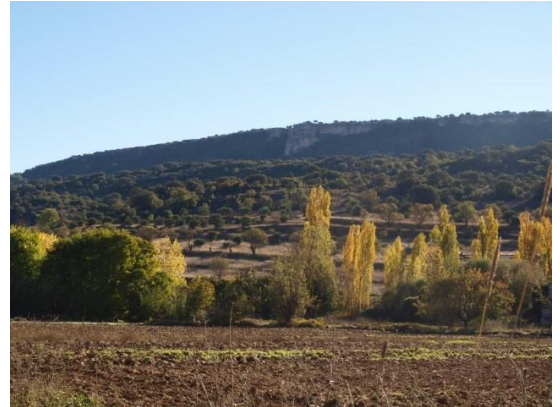
Bosque de ribera y al fondo olivares y monte mediterráneo