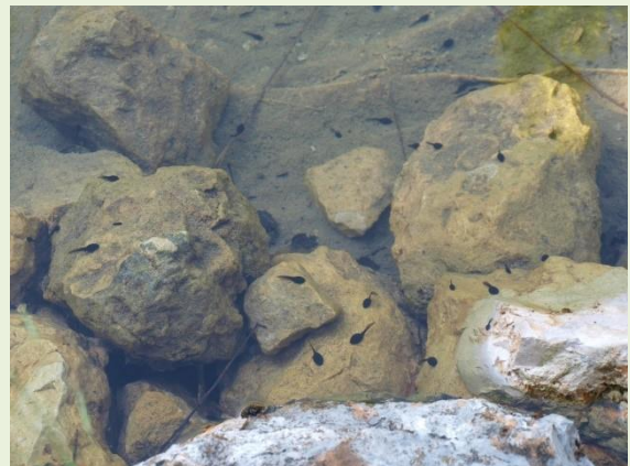
Renacuajos en la charca de anfibios

Charca artificial, para conservación y reproducción de anfibios